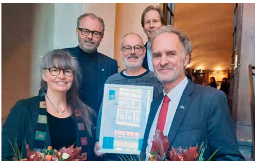
Aktionsgruppen Ryssland ut ur Ukraina blev Årets FN-vän 2023. Vem blir Årets FN-vän?