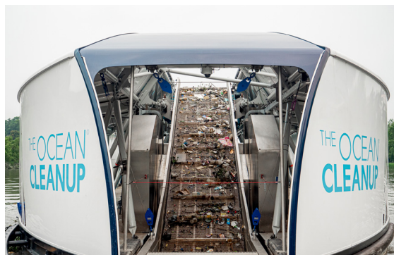
Bilder: The Ocean Cleanup