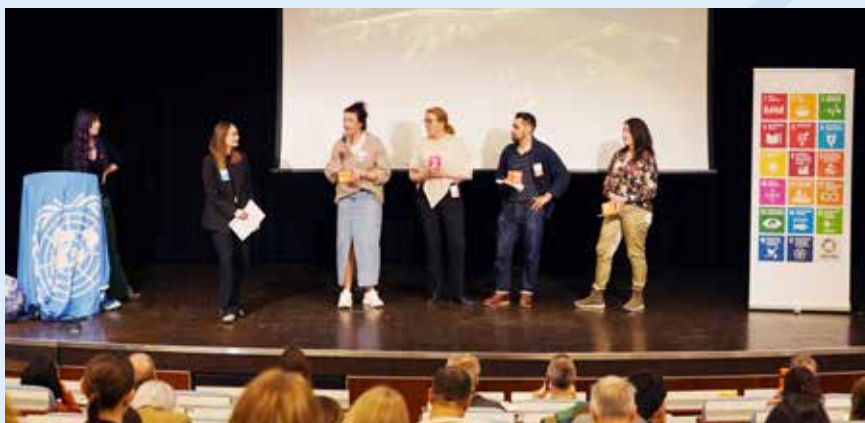
Nytt för i år var att olika organisationer agerade värdar för de olika globala målen.