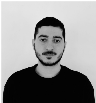
FLAKTRIM HANI Nominerad till ledamot