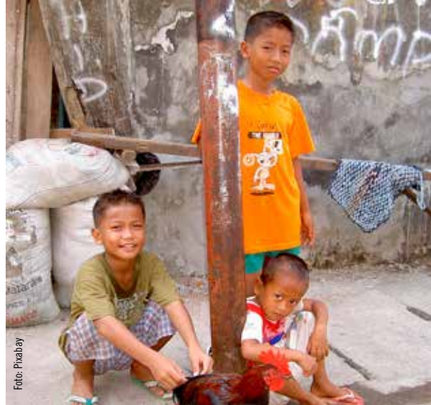
Enligt FN:s beräkningar kommer 70 procent av jordens befolkning att bo i städer 2050. Bilden visar barn på en gata i Indonesien.

BISTÅ DE MINST UTVECKLADE LÄNDERNA MED HÅLLBAR OCH MOTSTÅNDSKRAFTIG BYGGNATION