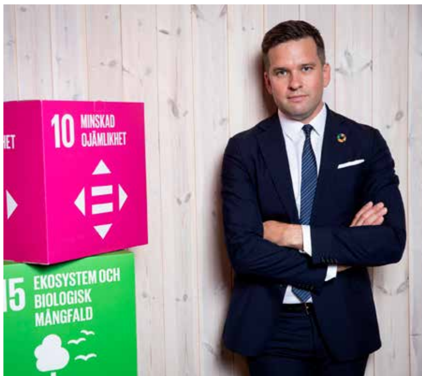
Gabriel Wikström är nationell samordnare för Agenda 2030 till den sista mars 2024.

Forskningen pekar på att vårt samhälle måste transformeras men inga ledande svenska politiker har hittills visat det politiska mod som krävs för en så genomgripande förändring. Det säger Gabriel Wikström, nationell samordnare för Agenda 2030, som samtidigt understryker att det är “oerhört bråttom” att göra omställningen.