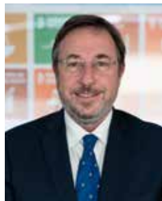
Achim Steiner, chef för FN:s utvecklingsprogram UNDP.