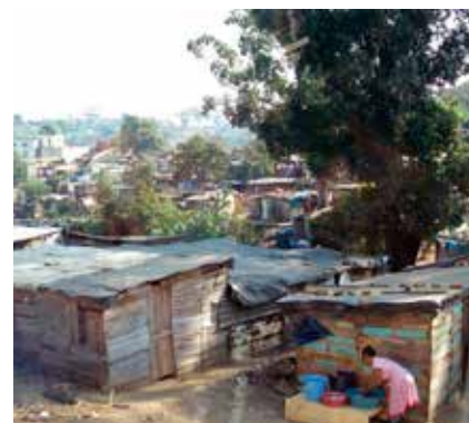
I Afrika söder om Sahara bor 230 miljoner människor i slum och kåkstäder. Bilden är från Sydafrika.

Den fullständiga texten för mål 11 samt de indikatorer som hör till framgår av rutan på föregående uppslag.