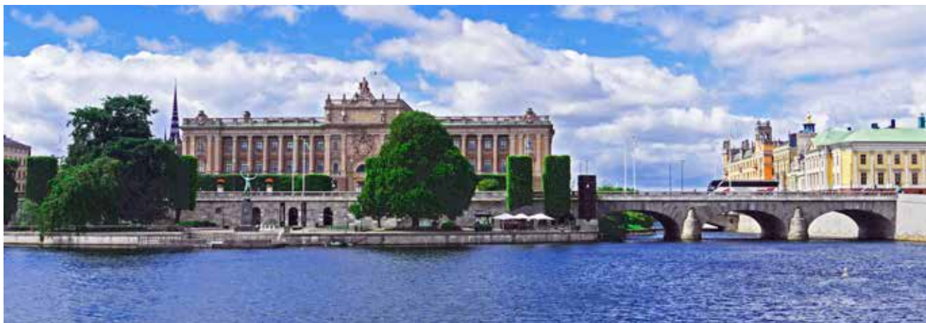
Sveriges riksdag är belägen på Helgeandsholmen mellan Gamla Stan och Norrmalm.