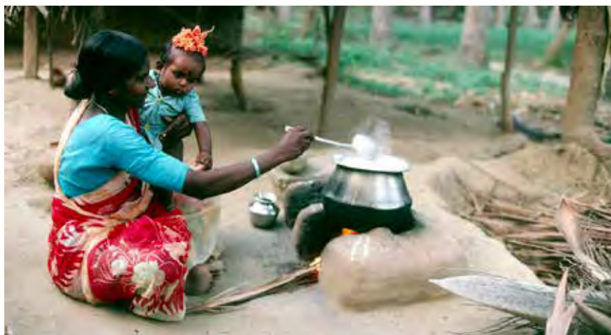
Matlagning över öppen eld är ett stort hälsoproblem i många länder. På bilden kokar en kvinna ris i Tamil Nadu, Indien.

Överlag krävs större politisk vilja, långsiktig energiplanering och genom-