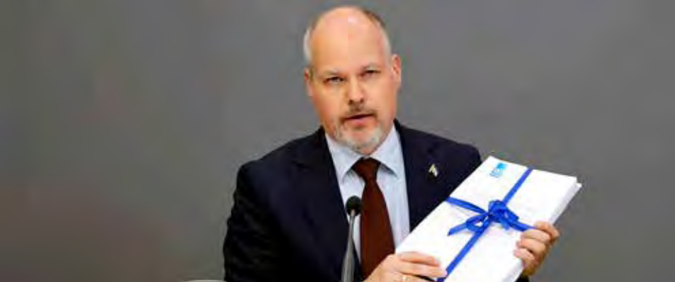
Justitieminister Morgan Johansson håller upp FN-förbundets namninsamling under regeringens presskonferens den 4 maj.