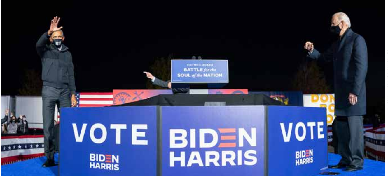
Joe Biden (till höger) i ett kampanjmöte i oktober 2020 tillsammans med tidigare presidenten Barack Obama.