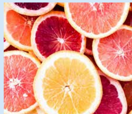
2021 är bland annat fruktens år.

Internationella året för frukt och grönsaker drivs av FN:s livsmedels- och jordbruksorganisation FAO och instiftades för att skapa medvetenhet om betydelsen av frukt och grönt för näringsintag, mat-säkerhet och hälsa.