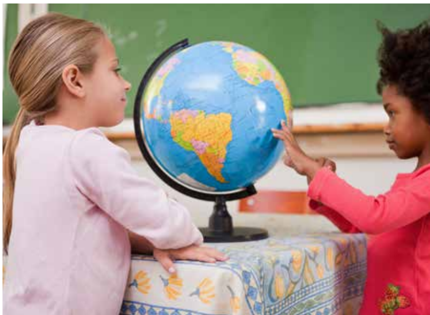
Skolan spelar en viktig roll för grundläggande värderingar som rör bland annat hållbar livsstil, globalt medborgarskap och allas lika värde.