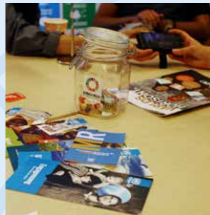
FN-skolan och FN-föreningen lyfter tillsammans olika FN-frågor.