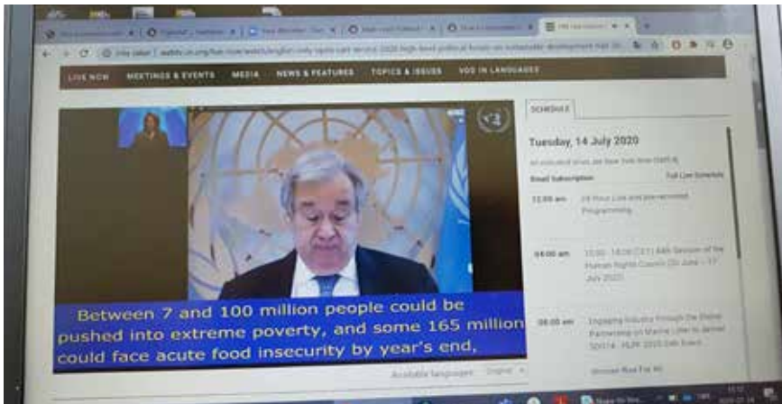
FN-chefen António Guterres under årets högnivåmöte för uppföljningen av Agenda 2030.