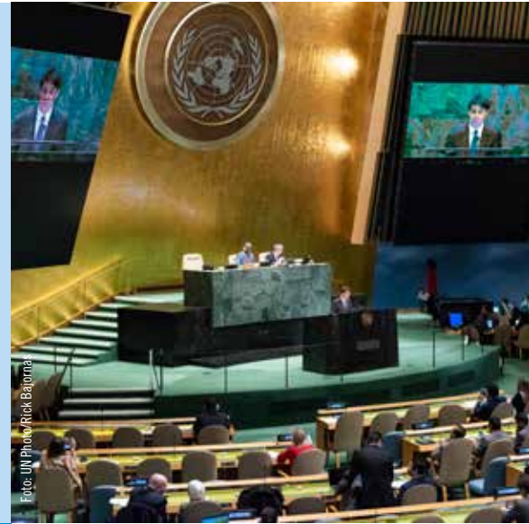
FN:s högkvarter i New York stod klart 1952. Bilden är från generalförsamlingen, det största rummet i byggnaden.