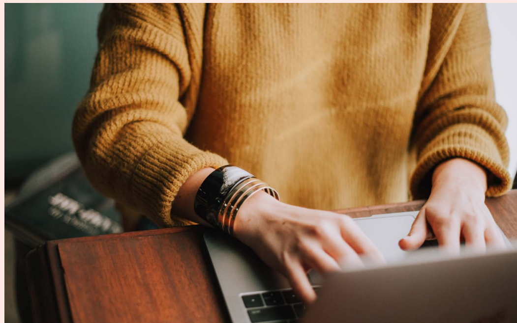
Kvinna sitter vid dator.

Diskrimineringsombudsmannen (DO) stämde Försäkringskassan med motiveringen att Försäkringskassan utsatt kvinnan för diskriminering i form