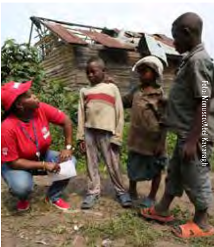
En anställd från FN:s minröjningsorganisation Unmas samtalar med några barn.

Vidare har 278 kartläggningar genomförts under projektperioden, vilket bidragit till att 3 000 kvadratkilometer av misstänkt