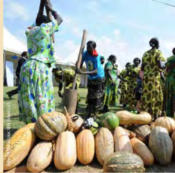
Två kvinnor stöter säd framför en rad pumpor på en jordbruksmarknad i Sydsudan.