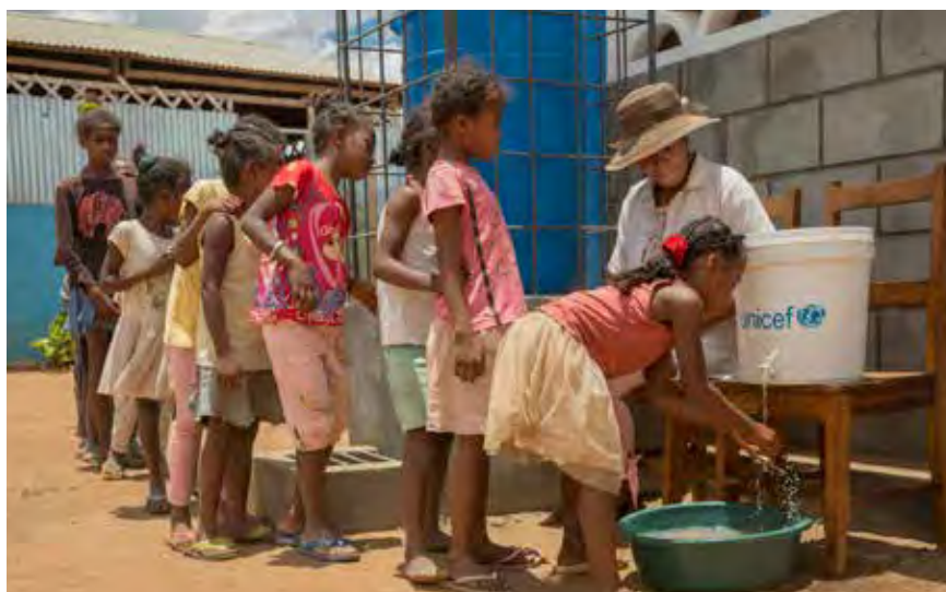
Förbättrad hygien och tillgång till toaletter är viktiga frågor för många skolor i låginkomstländer. Under coronapandemin har rutinerna för handhygien skärpts på de skolor som håller öppet.

WFP:s skolmatsprogram i Etiopien startade 1994 och är normalt igång i sex regioner i landet: Afar, Amhara, Tigray, Oromia, Somali samt SNNPR. I områden som präglas av klimatförändringar, svår matosäkerhet, migration och