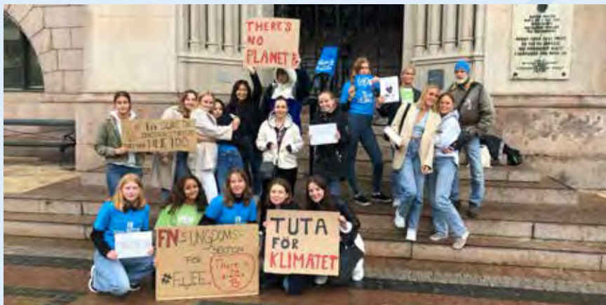
Före detta ungdomssektionen i Helsingborgs FN-förening, numera en del av styrelsen, under en klimatstrejk i höstas. Några vänner har också anslutit.