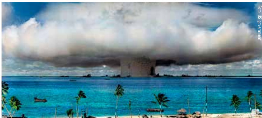
Amerikanskt kärnvapenprov på Bikiniatollen 1946.