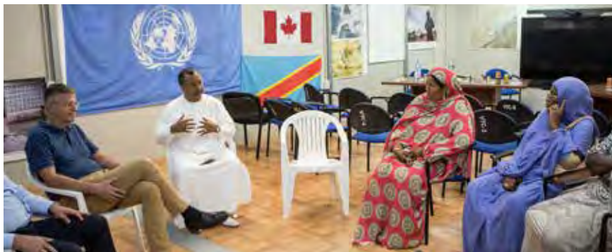
Jämställd fred är målet med FN:s resolution 1325. På bilden träffar chefen för FN:s fredsfrämjande insatser, Jean-Pierre Lacroix (i mörkblå skjorta), kvinnliga ledare i Kidalregionen i Mali för att diskutera fredsprocessen.

Resolution 1325 tillkom för att öka kvinnors inflytande i fredsprocesser och stärka kvinnors säkerhet. 20 år senare har den blivit ett viktigt verktyg för civilsamhället i konfliktländer.