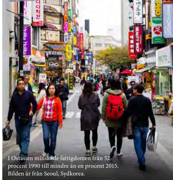
I Ostasien minskade fattigdomen från 52 procent 1990 till mindre än en procent 2015. Bilden är från Seoul, Sydkorea.

om att säkra de resurser och upprätta de regelverk som krävs för att delmålen 1.1 till 1.5 ska kunna nås (se rutan här ovanför).