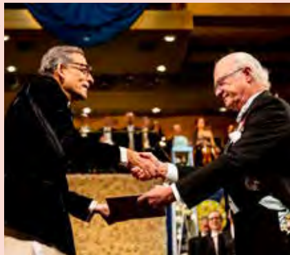
Fattigdomsforskaren Abhijit Banerjee tar emot Nobelpriset i ekonomi i Stockholms konsertshus den 10 december 2019.