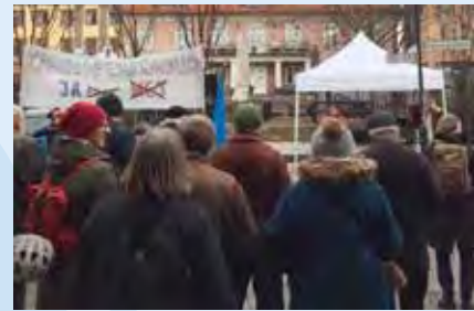
Kampen mot kärnvapen fortsätter i Falun.

Helge Sonntag från Dalarnas FN-distrikt talade om nödvändigheten av att avskaffa kärnvapen utifrån de senaste världshändelserna i Irak och Iran. Ett flygplan sköts ner av misstag. En kärnvapenmissil kan avfyra lika lätt, av misstag.