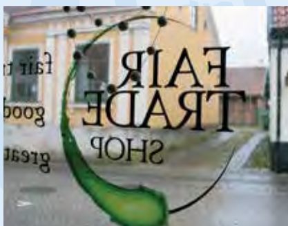
Butiken säljer rättvisemärkta varor.

Det som började med en liten plåtlåda som kassaapparat har idag utvecklats till en