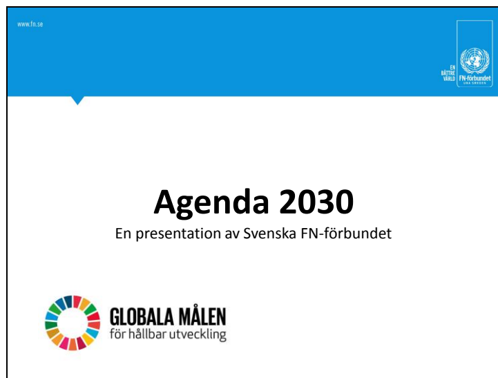
Bild 1 - Intro