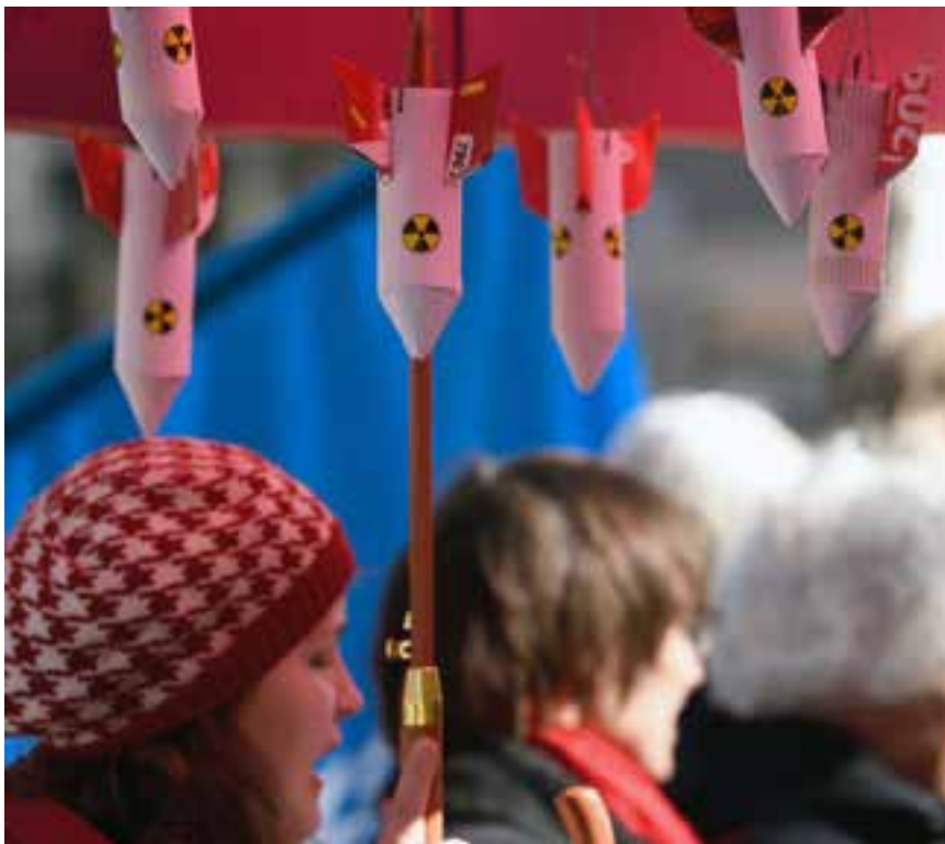
Isabell Hackner under Falu FN-förenings kärnvapenparaply.

och göra dem till fula vapen som ingen vill ha. Det är en lång process men det har gjorts med kemiska och biologiska vapen och vi vet att det går.