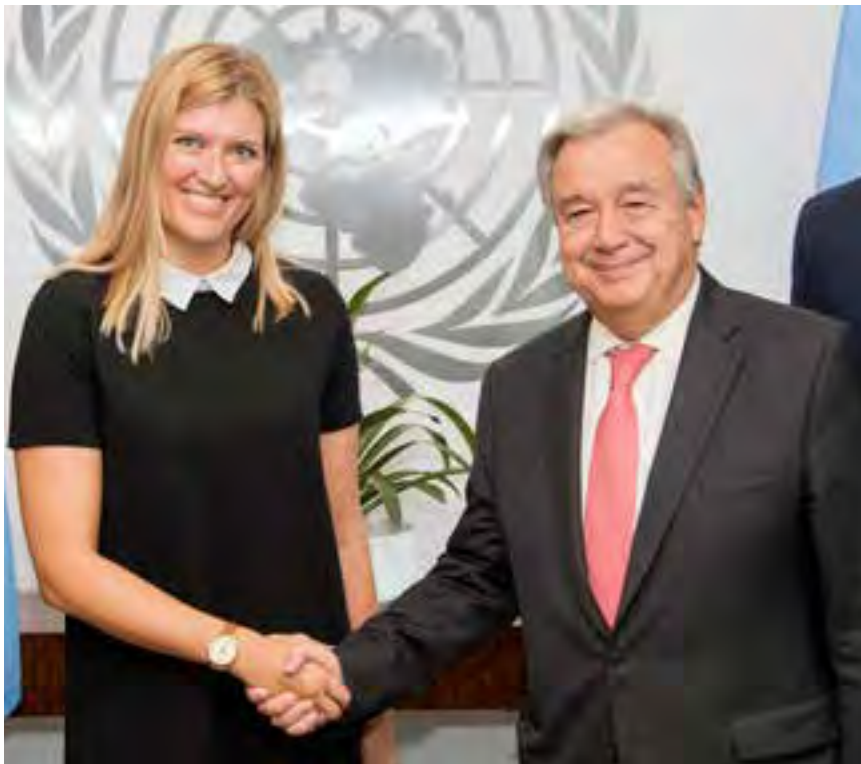
Svenska Beatrice Fihn är chef för Ican, International Campaign to Abolish Nuclear Weapons, och utsågs till Årets FN-vän 2018 av Svenska FN-förbundet. På bilden hälsar hon på FN:s generalsekreterare António Guterres.

civilsamhällesorganisationer som sedan 2007 har samordnat den internationella opinionen mot kärnvapen. Ican drev fram den utveckling som resulterade i den nya FN-konventionen om kärnvapenförbud och tilldelades för sitt arbete Nobels fredspris 2017.