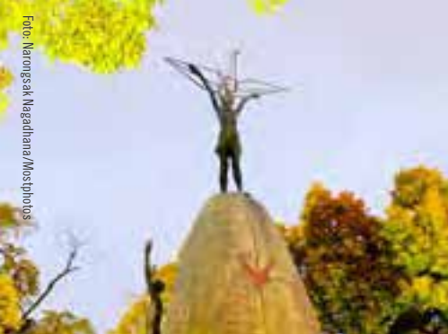
I fredsparken i Hiroshima finns en staty som föreställer flickan Sadako och en papperstrana.