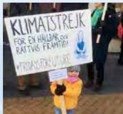
Liten aktivist kräver hållbar framtid.