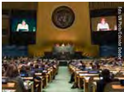
Vart 5:e år hålls en översynskonferens för icke-spridningsavtalet. Bilden är från 2015 års ”RevCon”.