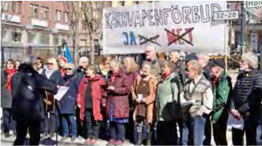
FN-förbundet och en rad andra svenska aktörer och organisationer menar att Sverige bör fortsätta att säga nej till kärnvapen, så som vi gjort sedan 1960-talet. På bilden tar Falu fredskör ton för ett ja till den nya konventionen om kärnvapenförbud.