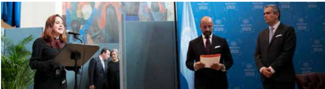
María Fernanda Espinosa Garcés, ordförande för FN:s 73:e generalförsamling, talar vid ett event för FN:s konvention för ett förbud mot kärnvapen.

det, d v s godkänt det i sina nationella parlament. TPNW träder i kraft när 50 stater har ratificerat det.