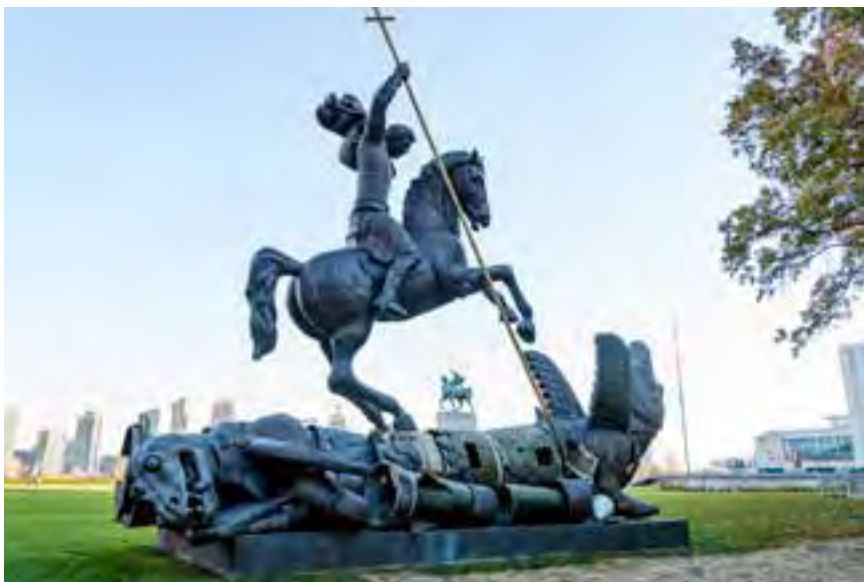
Skulpturen ”Det goda besegrar det onda” i trädgården utanför FN-högkvarteret skänktes av Sovjetunionen 1990. Skulpturens ”drake” är skapad av delar av sovjetiska och amerikanska kärnvapenmissiler som förstördes som ett resultat av INF-avtalet om medeldistansrobotar från 1987.