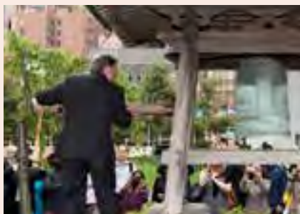
FN:s generalsekreterare António Guterres ringer i den japanska fredsklockan vid en ceremoni på internationella fredsdagen den 21 september 2018.