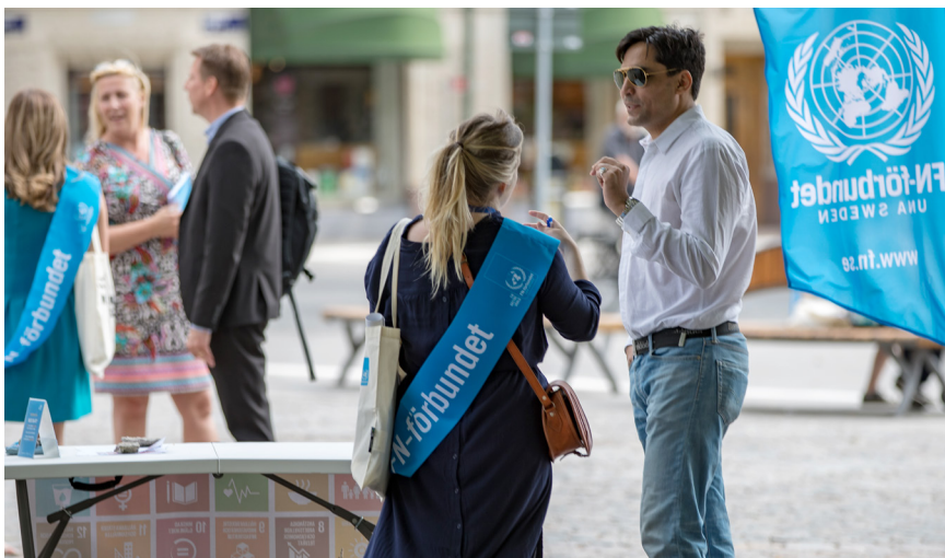
Det finns drygt 100 FN-förbund i världen. På bilden pratar representanter för Svenska FN-förbundet med förbipasserande på ett torg i Örebro.