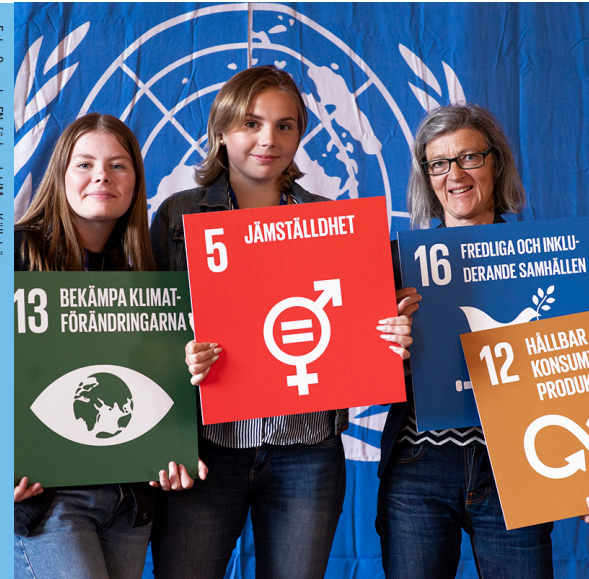
Tre medlemmar i Svenska FN-förbundet foto-graferade vid organisationens kongress 2018.