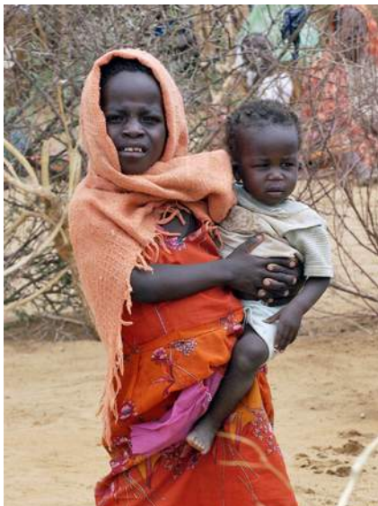
En flicka bär ett mindre barn i ett läger för internflyktingar i regionen Darfur, Sudan.

gör att de hamnar i utanförskap och lätt blir offer för trafficking eller prostitution. Risken är ännu högre om flickan i fråga har fått barn med en stridande eller till följd av våldtäkt.