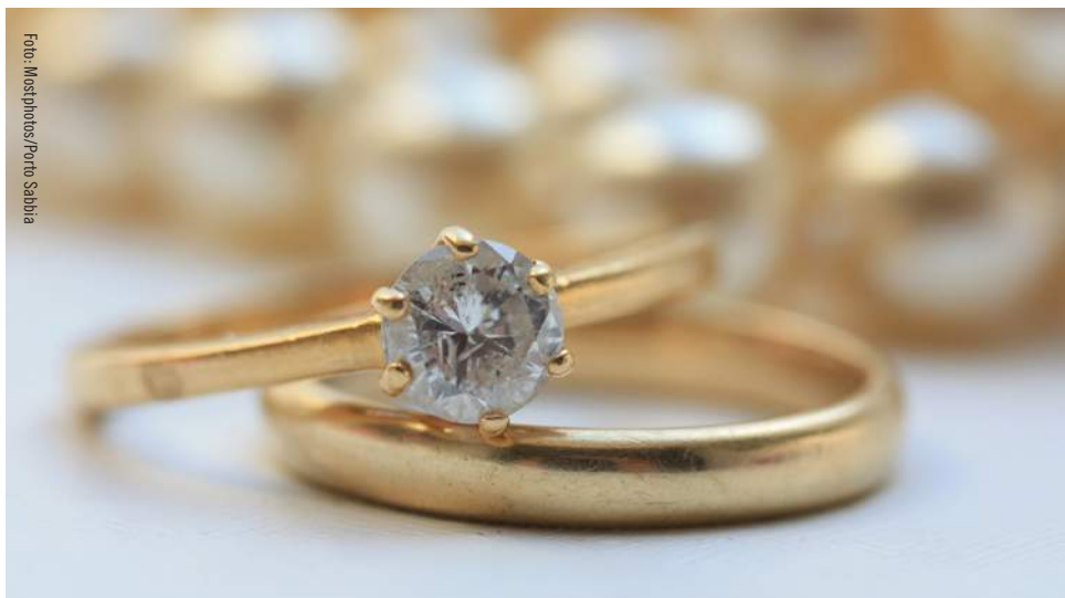
Trots en ny lag från 2014 finns fortfarande personer under 18 år i Sverige som betraktas som gifta av det svenska samhället.

Läs mer om flickor i konflikt på sid 11, om arbetet i Etiopien på sid 15 och om jämställdhet på sid 16!