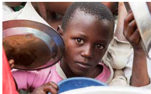
Elever kör för lunch i en skola i norra Kivuprovinsen, Demokratiska republiken Kongo.

Det finns möjlighet att reservera sig mot delar av konventionstexten, något som många länder utnyttjar. Ett problem med detta är att innehållet i konventionen riskerar att urholkas om länder reserverar sig mot alltför många eller