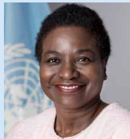
Nya UNFPA-chefen Natalia Kanem.

I oktober besökte Kanem Sverige för att delta vid lanseringen av UNFPA:s årliga rapport om världens befolkning ( State of the World Population ) tillsammans med Svenska FN-förbundet och UD på FN-skolan ISSR ( International School of the Stockholm Region ).