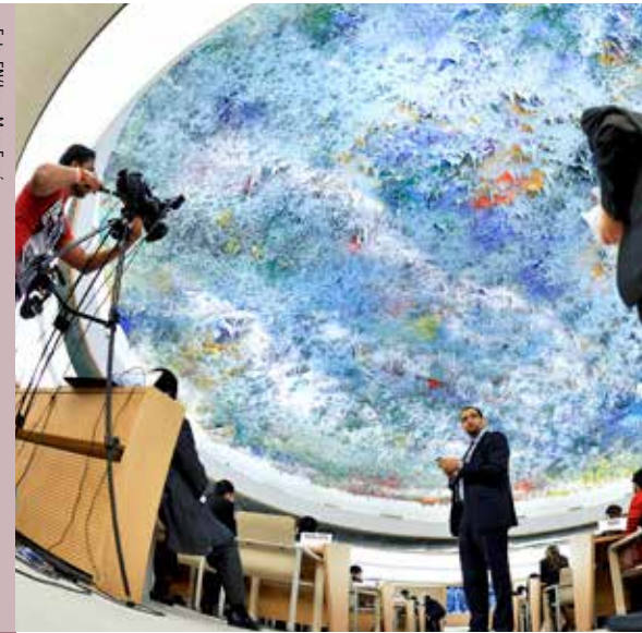
FN:s råd för mänskliga rättigheter i Genève. Konstnären Miquel Barcelò har utsmyckat taket i salen.