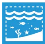
14.5 Bevara kust- och havsområden