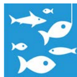
14.4 Hållbart fiske