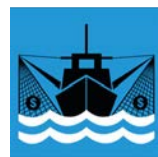
14.6 Avskaffa subventioner som bidrar till överfiske