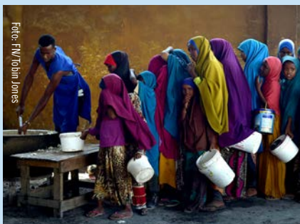
Flickor köar för att hämta mat i ett center för nödhjälp i Somalias huvudstad Mogadishu.