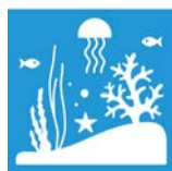
14.2 Skydda och återställ ekosystemen