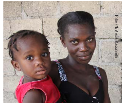
Att pengar saknas till viktiga humanitära insatser är en stor utmaning för FN-systemet. På bilden en kvinna och hennes barn i Haiti.