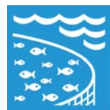
14.7 Hållbar förvaltning av marina resurser

Ett svenskt team vid kommunikationsbyrån Trollbäck ligger bakom de färggranna ikonerna som symboliserar de 17 globala målen. De står även bakom kortbenämningarna på varje mål (t ex ”Hav och marina resurser” i stället för ”Bevara och nyttja haven och de marina resurserna på ett hållbart sätt för en hållbar utveckling”).