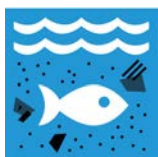
14.1 Minska föroreningarna i haven