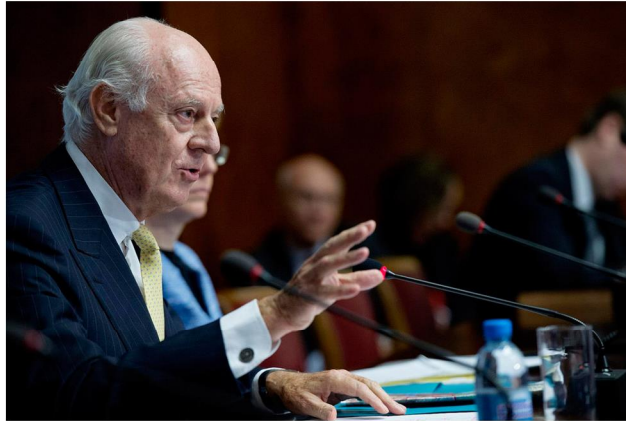
Staffan de Mistura utses till nytt FN-sändebud till Syrien.

Det syriska inbördeskriget är en pågående konflikt mellan myndigheter, i ledning av Bashar al-Assads Baath's regim, och flera oppositionsgrupper. Det pågår även strider mellan de olika oppositionsgrupperna. Den islamska staten (IS), tidigare främst verksamma i Irak, kontrollerar stora områden i östra Syrien. IS håller en stark position i inbördeskriget och har i stor grad på grund av kriget kunnat växa ännu mer. De länder som tidigare varit upptagna med att stötta oppositionsgrupper, såsom USA och Saudiarabien, lägger nu mer fokus på att bekämpa IS, både i Syrien och i Irak