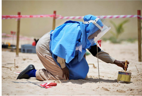
FN:s minröjningsorganisation, UNMAS, grundas.

UNMAS. FN:s minröjningsorganisation, grundades 1997 av Generalförsamlingen för att stötta FN:s vision om en värld fri från hotet från minor och andra explosiva lämningar.