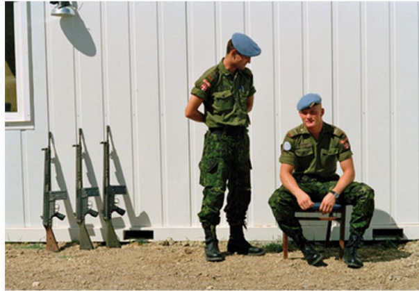
Principen skyldighet att skydda antas.

Vid ett toppmöte i FN 2005 enades världens länder om en ny folkrättslig princip: skyldighet att skydda eller Responsibility to Protect ("RtoP"). Syftet var att ge världssamfundet större möjlighet att ingripa för att skydda civilbefolkningar från folkmord, etnisk rensning, krigsbrott och brott mot mänskligheten. Denna princip är ett verktyg för att i första hand förhindra att dessa övergrepp begås, men även för att ingripa om det förbyggande arbetet misslyckas. Tidigare hade FN:s konflikthantering baserats på staters suveränitet och på att denna ska respekteras. FN får enligt stadgan bara ingripa när det finns ett hot mot internationell fred och säkerhet, inte så länge den väpnade konflikten sker inom ett lands gränser. Men efter misslyckandena på 1990-talet insåg man att denna princip har resulterat i att män och kvinnor länge kunnat utsättas för övergrepp som tvångsförflyttning, sexuellt våld och avrättningar medan världssamfundet bara sett på utan legitimitet att ingripa.