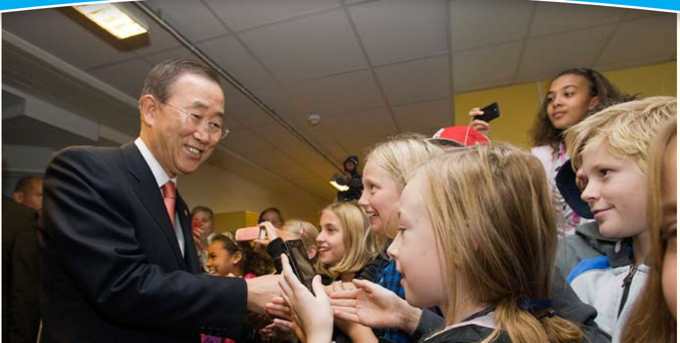
FN:s generalsekreterare Ban Ki-moon träffar barn på en skola i Stockholm i oktober 2009.