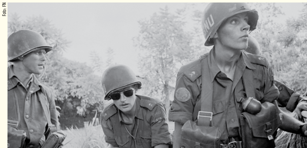
Svenska FN-soldater i Kongo patrullerar i utkanten av staden Leopoldville i december 1961.

De globala utmaningarna kräver, förutom ett starkt FN, ett nära samarbete med regionala och andra organisationer. I EU:s säkerhetsstrategi, som antogs i december 2003, anges att effektiv multilateralism med FN i centrum är ett mål för EU:s säkerhets- och utrikespolitik.