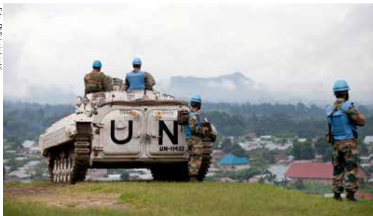
Världens just nu största FN-ledda fredsbevarande insats är MONUSCO i DR Kongo. På bilden står några FN-soldater på vakt vid Bunagana i norra Kivuprovinzen.

sen MINUSMA i Mali. Bidraget skulle omfatta ett transportflygplan (C-130 Hercules) och i det svenska förbandet skulle även ingå en flygsäkringsstyrka, en flygtransportenhet och en nationell stödenhet. Det svenska bidraget skulle uppgå till ca 70 personer och vara operativt från oktober 2013 till januari 2014. FN meddelade dock senare att Sveriges bidrag inte kunde tas emot eftersom landningsbanorna i norra Mali inte skulle klara av tyngden av Herculesplanet. Det svenska bidraget till MINUSMA består istället endast av fem stabsofficerare.