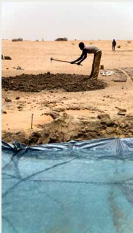
I Tora i norra Darfur, Sudan, ska en skola för fyra barnsoldater byggas. Vattnet på bilden har levererats till platsen för att man ska kunna tillverka tegelstenar.