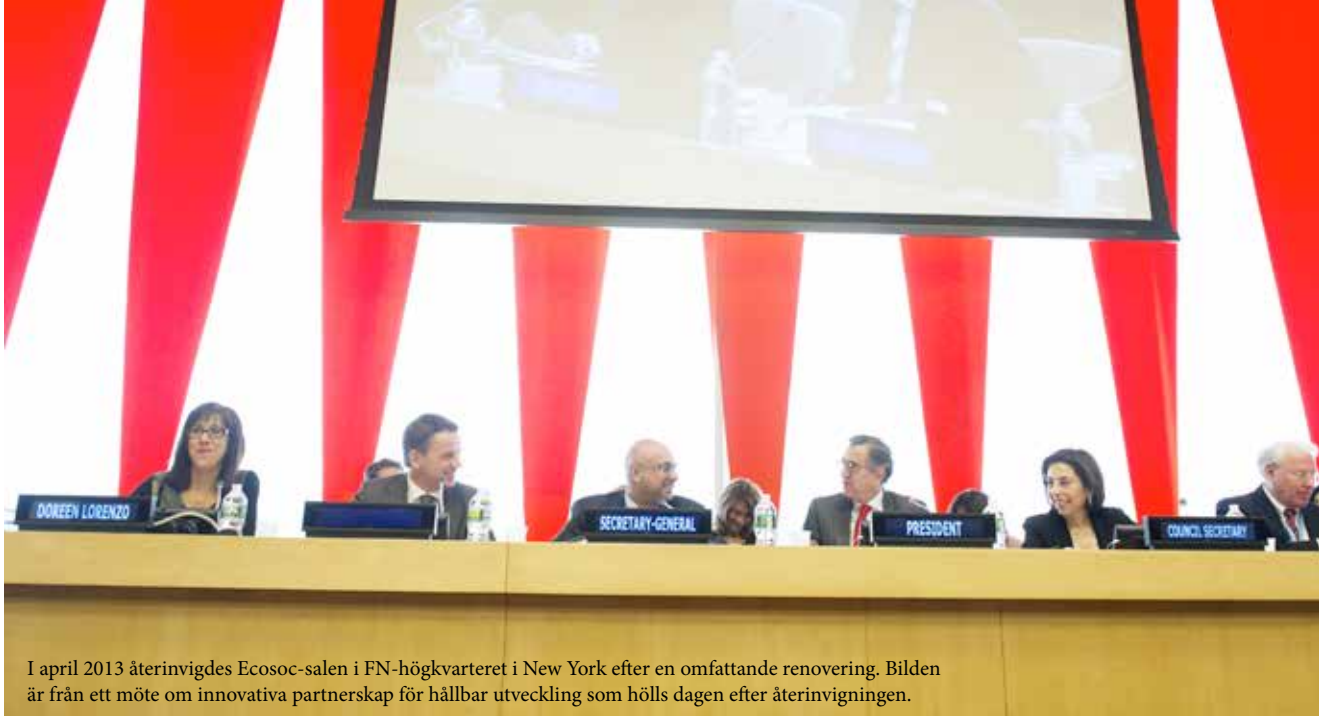
I april 2013 återinvigdes Ecosoc-salen i FN-högkvarteret i New York efter en omfattande renovering. Bilden är från ett möte om innovativa partnerskap för hållbar utveckling som hölls dagen efter återinvigningen.