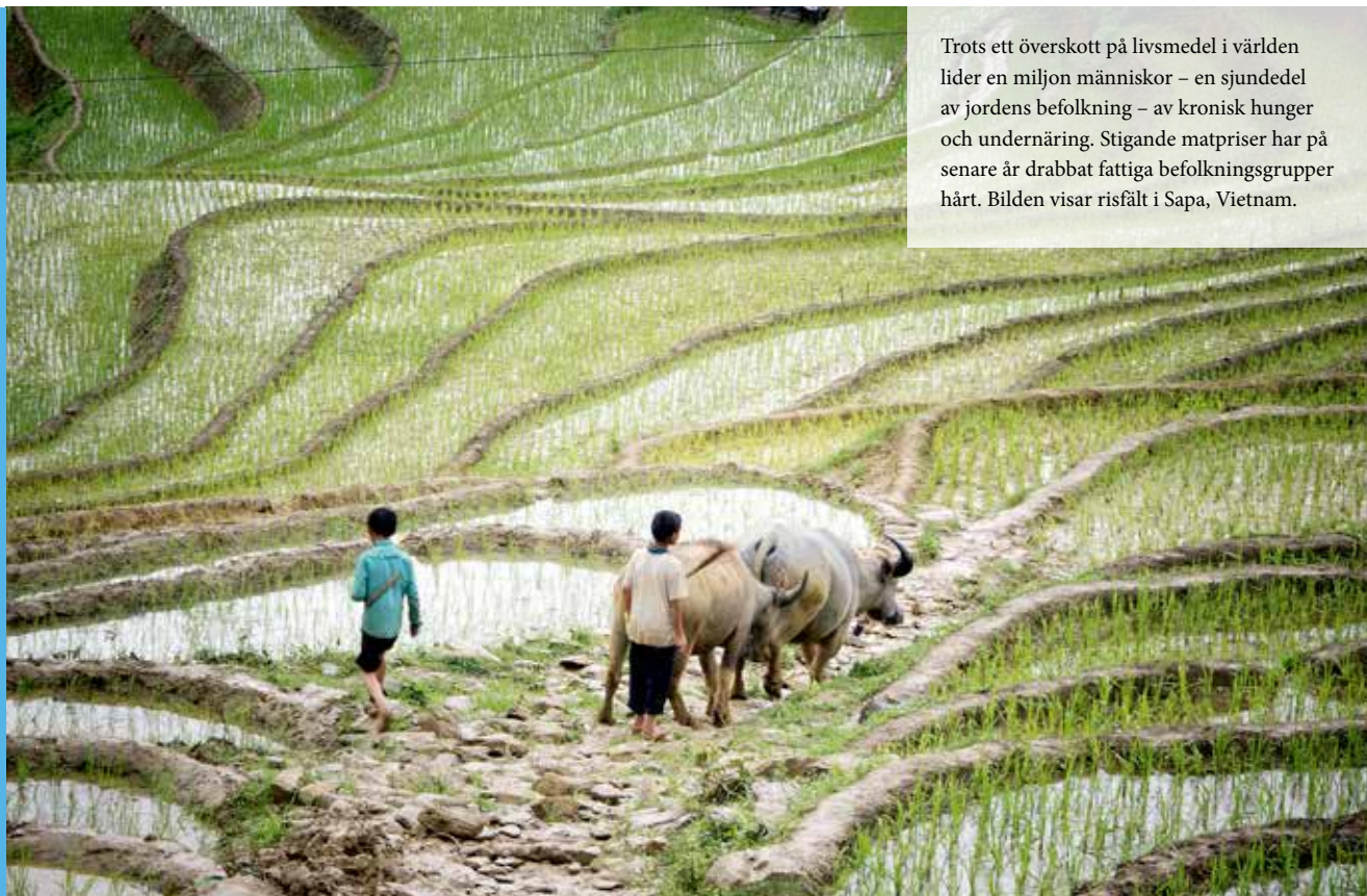
Trots ett överskott på livsmedel i världen lider en miljon människor – en sjundedel av jordens befolkning – av kronisk hunger och undernäring. Stigande matpriser har på senare år drabbat fattiga befolkningsgrupper hårt. Bilden visar risfält i Sapa, Vietnam.

Det är genom programmen, fonderna och fackorganen som FN bedriver sitt operativa arbete i fält. Insatserna kan innefatta t ex rådgivning, utbildning, tekniska hjälpmedel, läkemedel, medicinsk utrustning, livsmedelsbistånd och lån. De kan avse långsiktigt utvecklingsarbete såväl som humanitärt bistånd till människor i konflikter och katastrofer. Dessa organ omsätter de utvecklingsbeslut, som FN:s medlemsländer tillsammans har fattat, i praktisk handling. Därmed bidrar de till social och ekonomisk utveckling i världen.