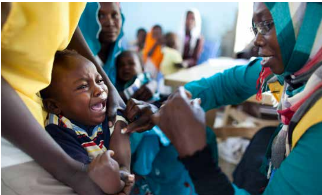
Ett barn i Darfur, Sudan, vaccineras mot hjärnhinneinflammation. Världshälsoorganisationen WHO och Sudans regering inledde i oktober 2012 en vaccinationskampanj med målet att vaccinera närmare 17 miljoner människor i regionen Darfur mot sjukdomen.

Coordinator ) skulle utses för att koordinera landteamets insatser.