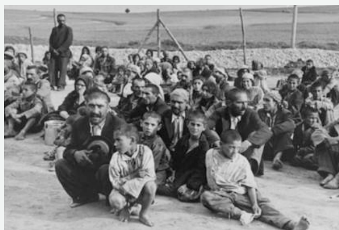
En grupp romer i koncentrationslägret Belzec i Polen 1940.

De kommunistiska Röda khmererna hade makten i Kambodja 1975-1979. De började med att tvinga ut städernas befolkning på landsbygden. De som inte lydde order döddes. Intellectuella och välutbildade avrättades tillsammans med sina familjer. Sjuka, gamla och funktionshindrade fördrevs och minoritetsgrupper mördades. Resten av folket gjordes till slavarbetare. Sammantaget miste minst 1,7 miljoner människor livet