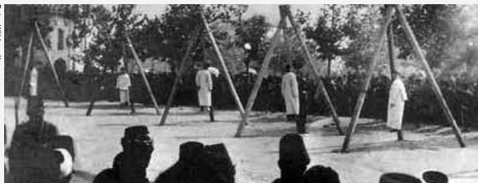
Konstantinopel (nuvarande Istanbul) i juni 1915: armenier avrättas genom hängning.

2003 antog FN:s generalförsamling en resolution om rättegångar i Kambodja mot Röda khmerernas ledare. Efter utdragna förhandlingar om formerna för processen kunde verksamheten igångsättas 2007. Rättegångarna är en nationell process men har stöd av FN och det officiella namnet är Extraordinary Chambers in the Courts of Cambodia (ECCC) .