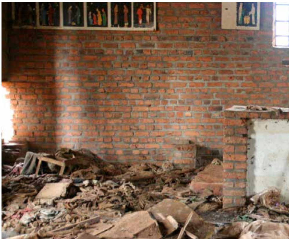
I kyrkan i Ntrama, Rwanda, sökte 5 000 människor skydd undan folkmordet 1994 men blev skoningslöst dödade av handgranater, machetes och gevär eller brända till döds. Det mesta av deras kvarlevor har flyttats till en intilliggande byggnad men en liten del lämnades kvar.

främst mot välutbildade och intellektuella och därför var det problematiskt att tala om folkmord. Men eftersom vissa etniska och religiösa grupper också drabbades har man med nöd och näppe lyckats applicera folkmordsbegreppet på situationen, säger Bring.