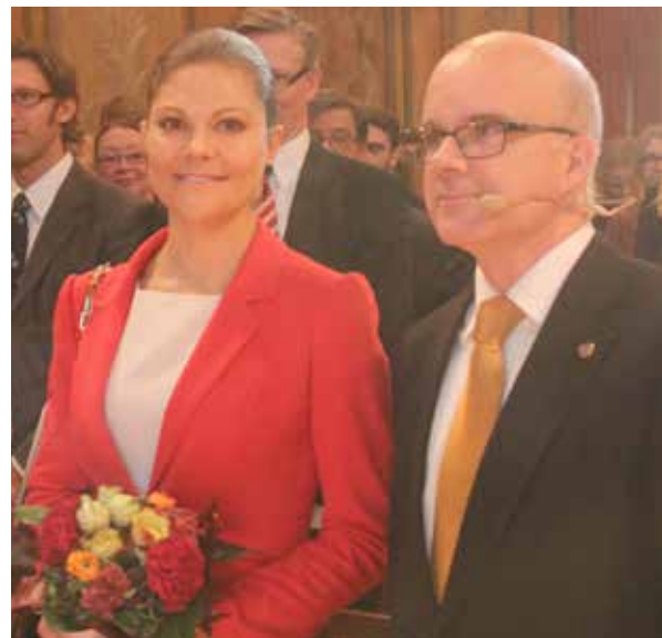
Kronprinsessan Victoria närvarande för andra året i rad vid FN-förbundets FN-dagsevenemang i Stockholms konserthus.