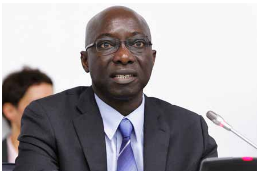
Adama Dieng, FN:s nye särskilde rådgivare för förhindrandet av folkmord, talar i generalförsamlingen.