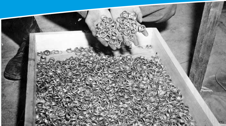
Några av de tusentals vigselringar som amerikanska soldater hittade vid koncentrationslägret Buchenwald i Tyskland tillsammans med klockor, smycken, glasögon och tandguld från offren för förintelsen. Bilden är tagen i maj 1945 av en amerikansk soldat.

fortsatt lobbyarbete röstades sedan FN:s konvention om förebyggande och bestraffning av brottet folkmord slutligen igenom med god marginal den 9 december 1948.