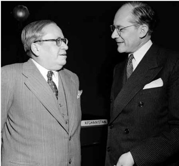
Folkmordskonventionens fader Raphaël Lemkin (till höger) i samspråk med Brasiliens FN-ambassadör Amado i samband med att konventionen antogs av FN:s generalförsamling i december 1948.

genom avrättningar, svält, utmattning och sjukdomar.