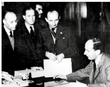
Raoul Wallenberg med sina medarbetare på svenska legationen i Budapest.