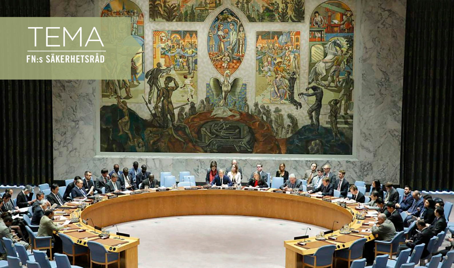
Säkerhetsrådet, med Sverige som ordförande, diskuterar hur freden i Västafrika ska säkras. Väggmålningen i salen, av den norske konstnären Per Krohg, skänktes till FN av Norge 1952.