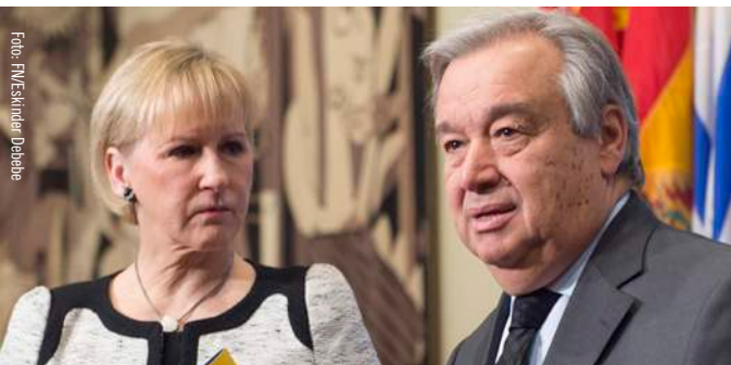
Sveriges utrikesminister Margot Wallström och FN:s nya generalsekreterare António Guterres möter pressen efter ett möte om konfliktförebyggande i säkerhetsrådet den 10 januari där Guterres medverkade.

”Sverige må vara ett litet land, men vi har hög trovärdighet i de här frågorna.”