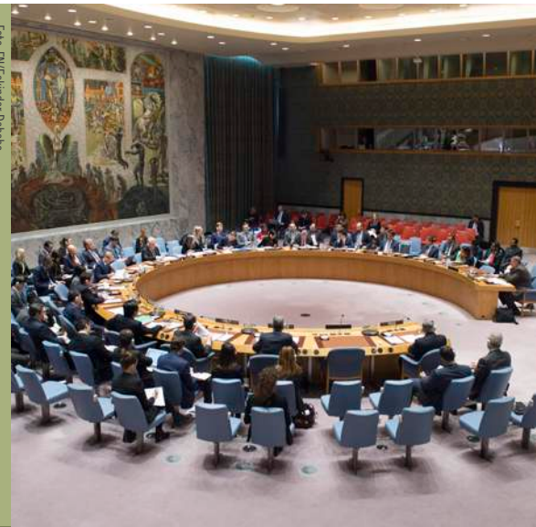
FN:s säkerhetsråd diskuterar situationen i Irak.