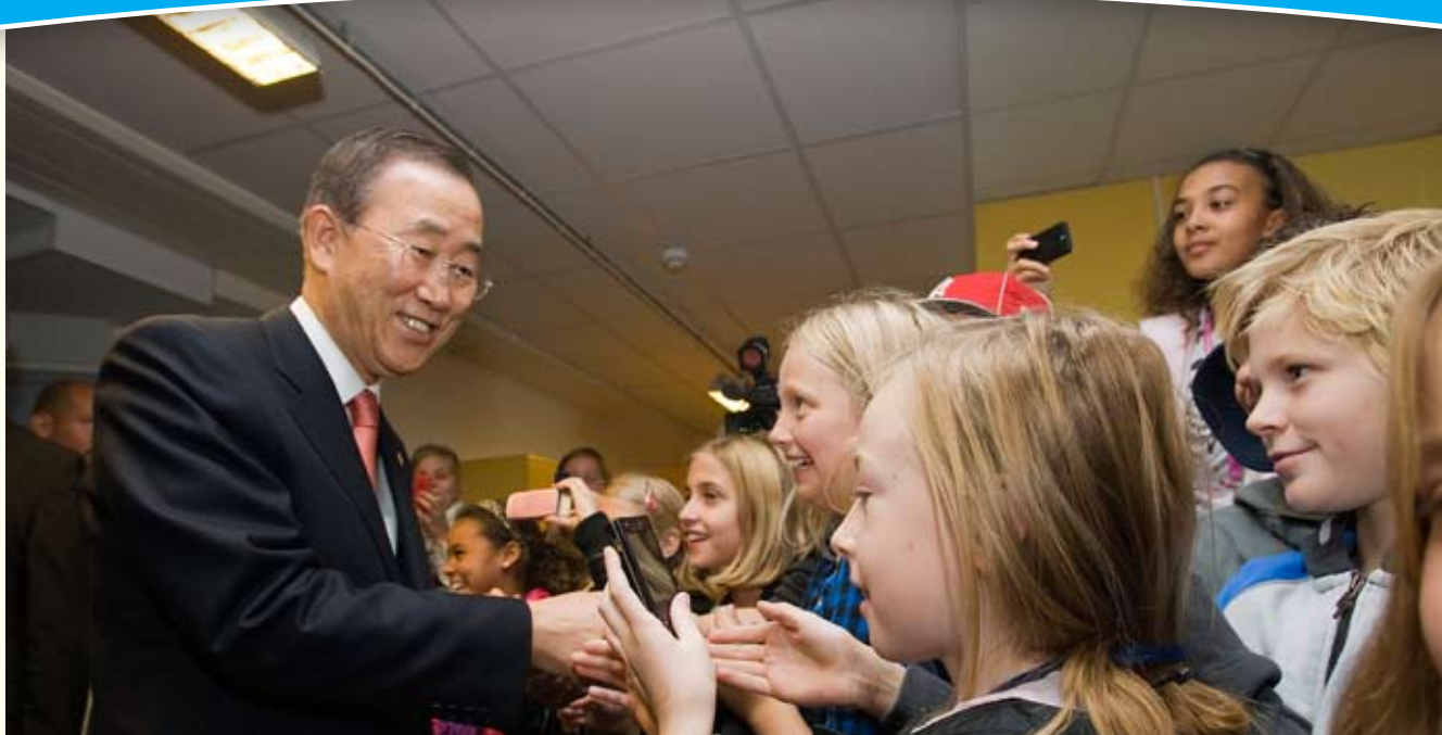
FN:s generalsekreterare Ban Ki-moon träffar barn på en skola i Stockholm i oktober 2009.