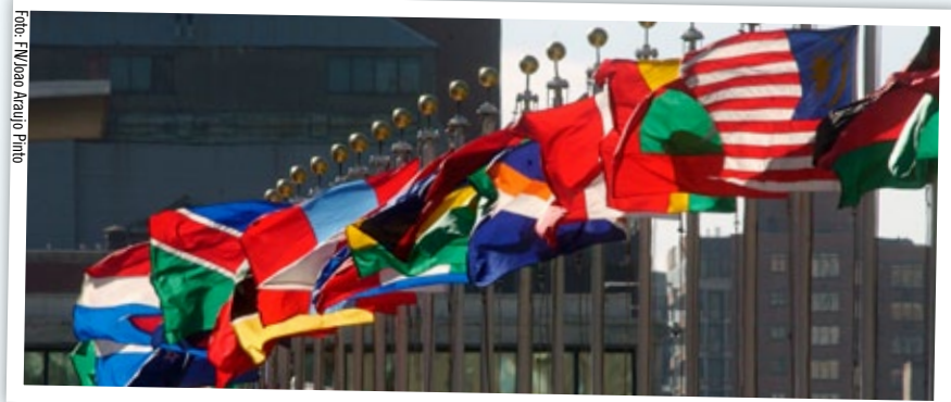
Medlemsländernas flaggor framför FN-högkvarteret på Manhattan i New York.