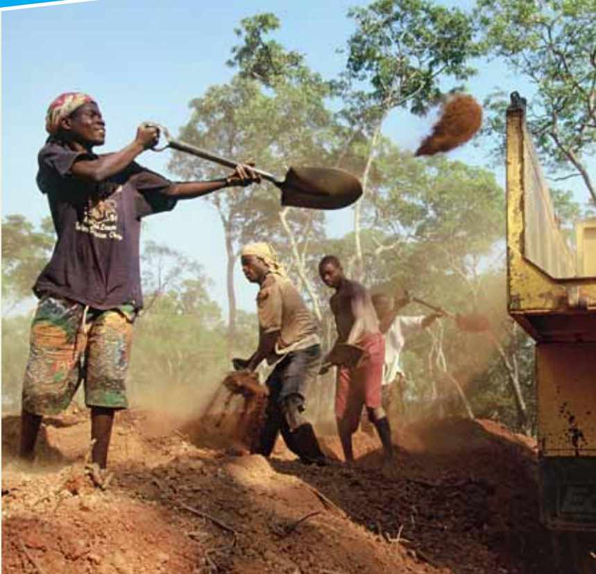
Minskad fattigdom genom landsbygdsutveckling är ett exempel på vad Sveriges multilaterala utvecklingssamarbete bidrar till. Bilden visar ett vägbygge i Mocambique.

arbetsländer, framför allt i Afrika söder om Sahara.