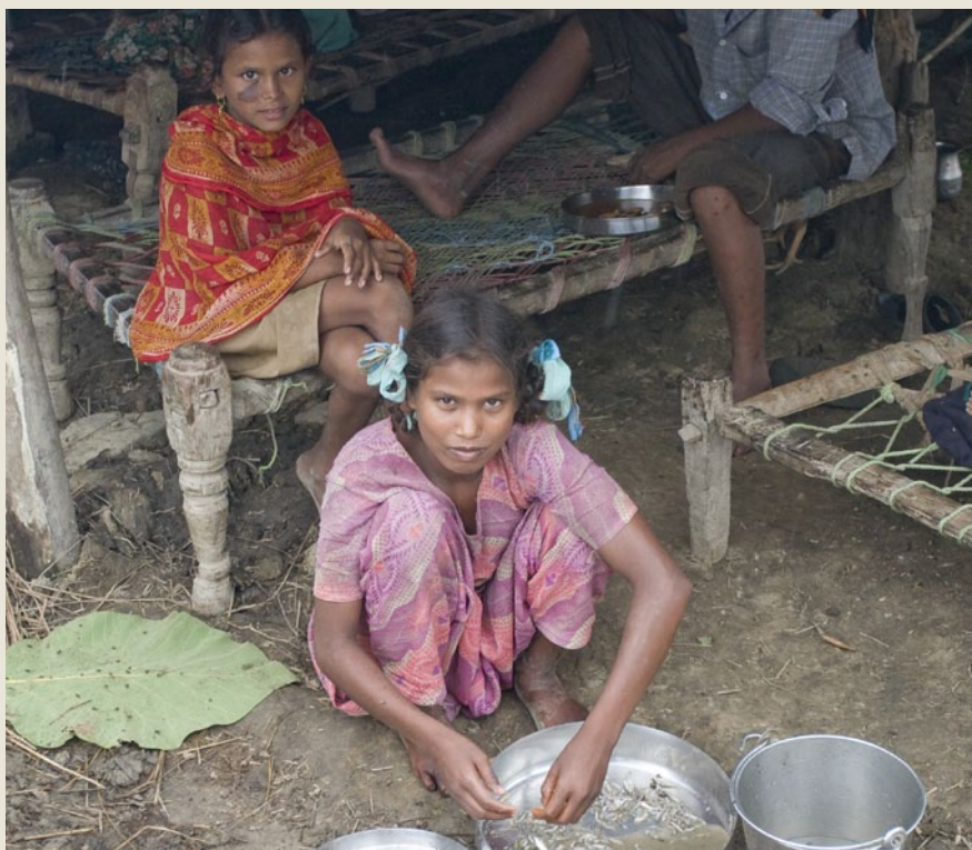
En flicka i byn Suragaudi, Nepal, hjälper till med maten.

FN:s livsmedels- och jordbruksorganisation FAO definierar tryggad tillgång till mat ("food security") som det tillstånd då alla människor, vid alla tidpunkter, har fysisk, social och ekonomisk tillgång till tillräcklig, säker och näringsrik mat. Detta