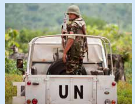
En soldat i FN-styrkan Minusca eskorterar FN-personal under ett besök i Centralamerikanska republiken.

Mogens Lykkesoft från Danmark är sedan den 15 september ny ordförande i FN:s generalförsamling. Lykkesoft har en lång politisk karriär bakom sig, bl a som finansminister och utrikesminister i Danmark. Idag är han talman för det danska parlamentet. Han efterträder Sam Kutesa från Uganda.