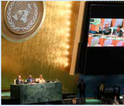
FN:s generalförsamling diskuterar agenda 2030.