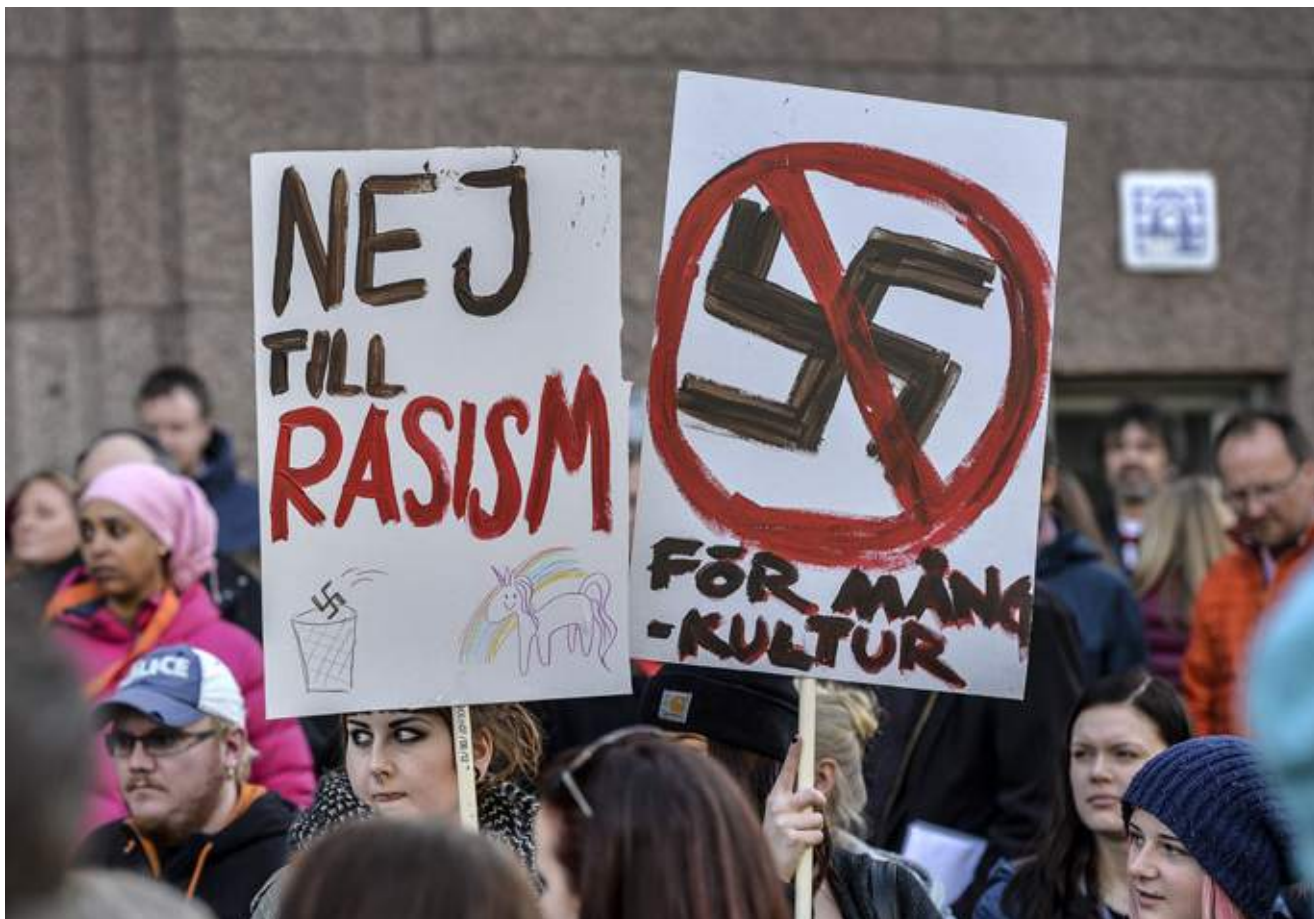
Elever, föräldrar och personal vid en gymnasieskola i Stockholm demonstrerar mot rasism och främlingsfientlighet.

CERD är en av FN:s nio s k kärnkonventioner som har granskningskommittéer knutna till sig. Kommittéerna består av oberoende experter som har som uppgift att granska att de stater som anslutit sig till konventionen följer dess bestämmelser.