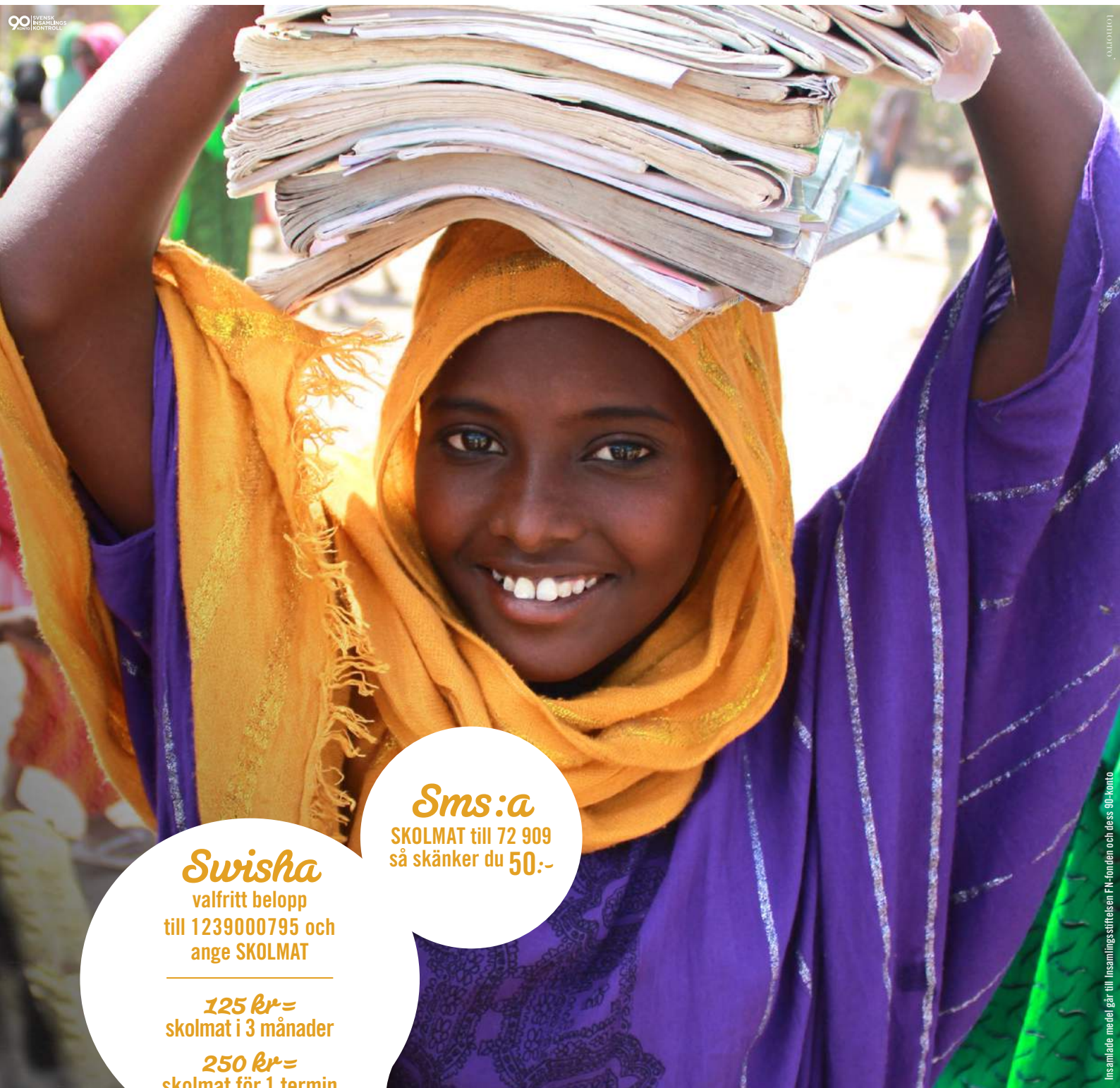
Insamlade medel går till Insamlingsstiftelsen FN-fonden och dess 90-konto