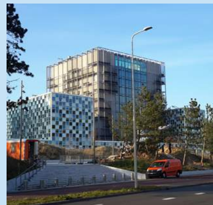
ICC:s nya permanenta högkvarter i Haag, Nederländerna.

Domstolen etablerades 2002 som en permanent tribunal för att åtala personer för folkmord, brott mot mänskligheten och krigsförbrytelser. Till grund för ICC ligger den sk Romstadgan som antogs 1998. ICC ( International Criminal Court ) ska inte blandas samman med Internationella domstolen ICJ ( International Court of Justice ) som instiftades 1945 och också har säte i Haag.