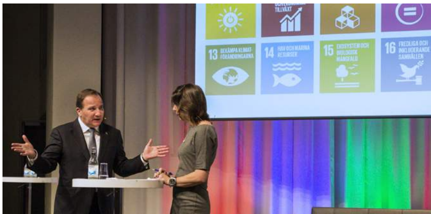
Statsminister Stefan Löfven intervjuas om Agenda 2030 vid regeringens lanseringskonferens i januari.