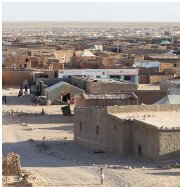
I provinsen Tindouf i västra Algeriet finns flera bosättningar för flyktingar från Västsahara. Lägret på bilden heter Smara.

I slutet av mars utvisade Marocko FN-personal från det ockuperade Västsahara. Man ansåg att Ban Ki-moon inte längre var neutral eftersom han sagt att Västsahara är ockuperat. Nu har säkerhetsrådet förlängt mandatet för FN-styrkan Minurso och krävt att styrkan ska återställas. FN-chefen varnar i en rapport för överhängande krigsrisk. De fem nordiska FN-förbunden kräver att Minurso ska övervaka människorätts-situationen i landet.